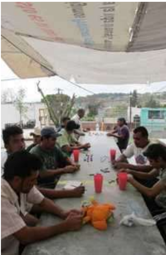
Migrantes descansan en la Posada Belén de Saltillo, Coahuila

Sus planes son quedarse un tiempo en Saltillo, conseguir un trabajo, ahorrar y partir. Desea salir de la Casa del Migrante, pero sabe que el peligro acecha en el exterior: Mi sueño es llegar a Estados Unidos y comprar una casa. Nunca he tenido una.